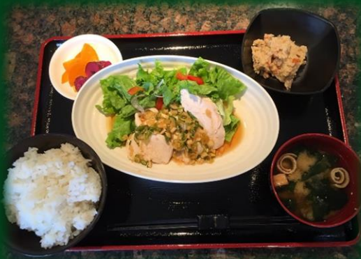
鶏肉のネギソース定食