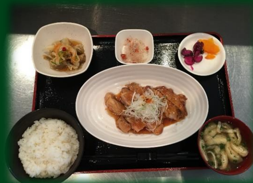
照り焼きチキン定食